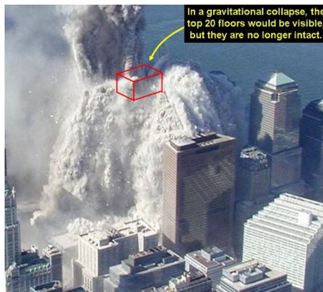
Bild 3: Zerstörung des Nordturms - Luftaufnahme (WTC 7 ist in der Mitte, rechts vom Mittelpunkt). - Text im Bild: Bei einem Einsturz aufgrund von Schwerkraft wären die oberen 20 Stockwerke sichtbar, aber sie sind hier nicht mehr intakt.

Niemals vor oder seit 9/11 sind stahlrahmengestützte Hochhäuser aufgrund von Bränden eingestürzt, noch niemals ist je von einem Gebäude bekannt geworden, dass es sich selbst zermalmt und pulverisiert hat. Hinzu kommt die Beschleunigung, welche annähernd beim Freien Fall liegt, wenn der kleinere obere Teil des Gebäudes nicht mehr länger getragen werden kann.